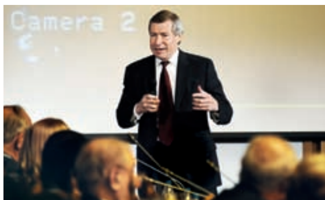
Американският посланик Джеймс Уорлик