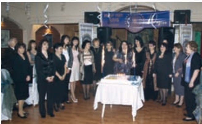
Десетият рожден ден на Инер Уил Видин

Имаше много пожелания за още дълги години ползотворна работа в името на идеите на Инер Уил. Сред аплодисментите на присъстващите дамите на Инер Уил клуб запалиха десетте свещички върху празничната торта и си пожелаха още дълги години да запазят приятелството и да множат добрите дела. От сърце благодарим на всички приятелки от клубовете в Дистрикт 248-България, на ротарианци и приятели, които ни честитиха десетгодишния юбилей.