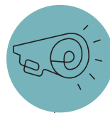
ПРЕССЪОБЩЕНИЯ/ МЕДИЕН PR