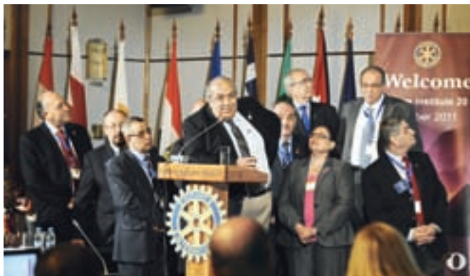
Ротарианците от Д-2450 поканиха участниците на следващия Зонален институт през 2011 г. в Египет

Група 8: ИСС – Междудържавни комитети с председател ПДГ Антъни Полстерер и модератори ПДГ Джовани Джандоло и ППРК Иларио Астинов.