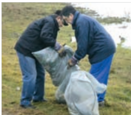
Страницата подготви Кольо Колев, секретар на РК Търговище

Почистено беше и близкото стрелбище от стотиците гилзи, оставени там неприбрани от ловците. По акваторията на водоема няма поставени съдове за изхвърляне на смет и предупредителни табели. За да не тъне районът в боклуци, РК Търговище ще постави такива. С инициативата си ротарианците искат да провокират и екосъзнанието на домакинствата, които имат вили по брега. Те също са сред замърсителите на околната природа. Екоинспекциите също стоят безучастни към престъпното поведение.