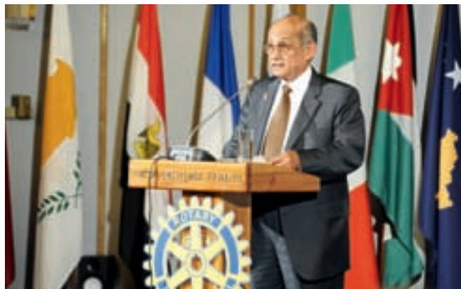
Калян Банерджи, президент елект на РИ

Встъпителната пленарна сесия , която постави началото на Института, бе открита с Ротарианската молитва, прочетена от ДГ Краси Ганчев. Последва традиционната церемония с флаговете на държавите в Зона 20-В, на държавите на гостува-