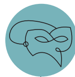
ПРЕЗЕНТАЦИИ/ СПЕЦИАЛНИ СЪБИТИЯ